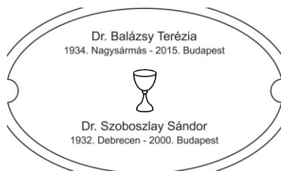
Erdélyi Halottak Emlékhelye MINTA 1