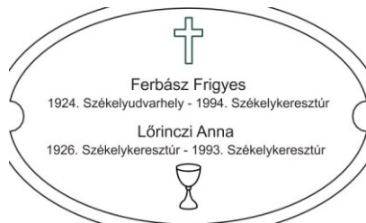
Erdélyi Halottak Emlékhelye MINTA 5