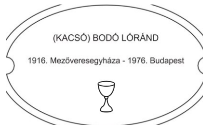
Erdélyi Halottak Emlékhelye MINTA 2