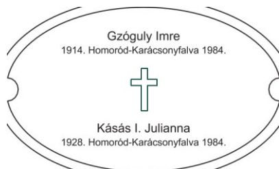
Erdélyi Halottak Emlékhelye MINTA 3